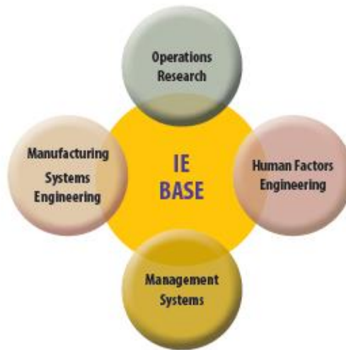
Σχήμα 1 . Διάγραμμα Venn. Μοντέλο γνώσεων Μηχανικού Παραγωγής και Διοίκησης προτεινόμενο από τον Διεθνή Οργανισμό Εργασίας

Μία σύγχρονη επέκταση αυτού του μοντέλου παρουσιάζεται σε ερευνητική εργασία από τους Ole Rokkjær et al. (2011) [12] όπου φαίνονται τα διάφορα γνωστικά πεδία που πρέπει να περιλαμβάνει το πρόγραμμα σπουδών ενός σύγχρονου Μηχανικού Παραγωγής και Διοίκησης. Η εργασία αυτή αποτέλεσε προϊόν ερευνητικού προγράμματος με τίτλο « Industrial Engineering Standards in Europe » και χρηματοδοτήθηκε από την Ευρωπαϊκή Ένωση. Στην παρούσα έρευνα γίνεται επίσης και μία οριοθέτηση των πεδίων γνώσεων σε προπτυχιακό και μεταπτυχιακό επίπεδο του ΜΠΔ. Είναι προφανές ότι στο προτεινόμενο πρόγραμμα σπουδών του Τμήματος Μηχανικών Παραγωγής και Διοίκησης του Διεθνούς Πανεπιστημίου της Ελλάδος ενσωματώνονται οι παραπάνω προτάσεις και ευρήματα της έρευνας και διδάσκονται σε βάθος μεταπτυχιακού επιπέδου κυρίως τα γνωστικά πεδία και αντικείμενα της καινοτομίας και τεχνολογίας, της τεχνολογίας παραγωγής, και των συστημάτων διαχείρισης.